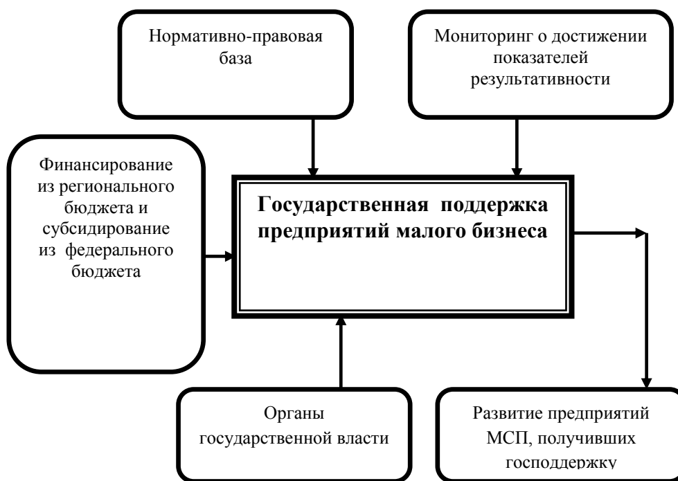
Рис. 1. Модель «Существующий механизм государственной поддержки малого предпринимательства в России»

Управляющее воздействие на процесс господдержки малого предпринимательства оказывает ряд законодательных и нормативно-правовых документов, представим структурно на рис. 2.