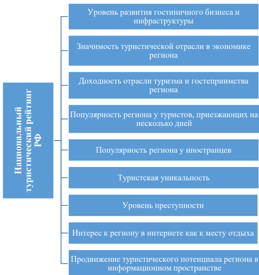
Рис. 2. Факторы Национального туристического рейтинга РФ

2. Рейтинг регионов России по индексу развития туристического потенциала, разработанного в рамках совместного проекта Сбер, РБК (РосБизнесКонсалтинг) и НКР (Национальные кредитные рейтинги).