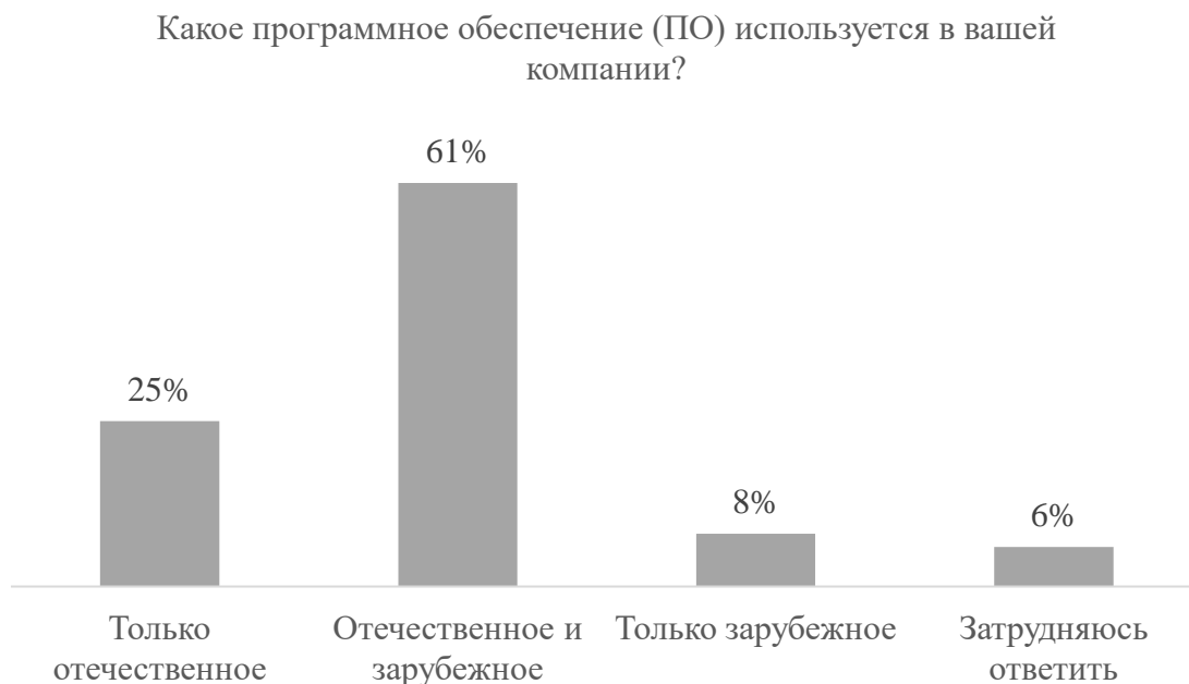
Рис. 4. Опрос среди респондентов на тему использования ПО в компании [9]

Вопросы импортозамещения являются актуальными для 69% опрошенных, среди которых 8% пользуются исключительно импортными продуктами, а 61% компаний совмещают работу российских программ и зарубежных. Вычислим показатель уровня внедрения отечественных решений в российских компаниях (табл. 4).