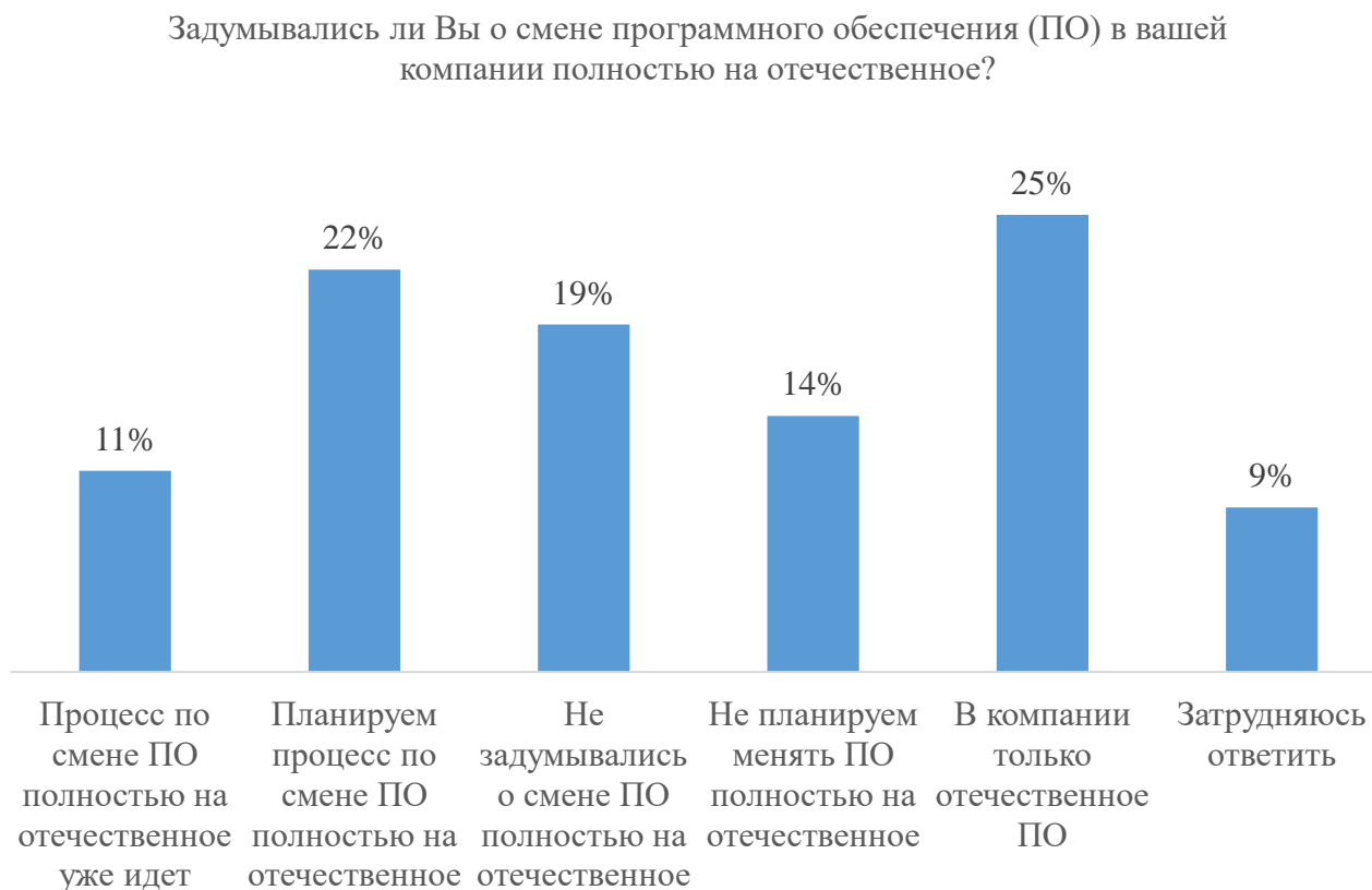
Рис. 3. Опрос среди респондентов на тему перехода полностью на отечественное ПО [10]

В отчетном периоде по сравнению с базовым периодом произошло снижение количества внедренных проектов почти по всем рассматриваемым программам. Это может быть связано с тем, что многие компании инвестировали в системы управления бизнес-процессами до 2022 года. Также предполагается, что большинство российских компаний ранее использовали в своей работе программы российских разработчиков. Для подтверждения или опровержения гипотезы рассмотрим исследование аналитического центра НАФИ, которое проводилось в середине 2022 года (рис. 3). В репрезентативном опросе приняли участие пятьсот представителей микропредприятий, малых и средних предприятий во всех федеральных округах Российской Федерации [10].