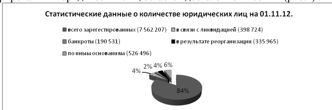
Рис.1. Зарегистрированные юридические лица на 1 ноября 2012 [4]

На наш взгляд, предложенные меры должны положительно повлиять на количество финансово устойчивых организаций, так как количество банкротств из числа зарегистрированных юридических лиц остается достаточно высоким (рис.1) .