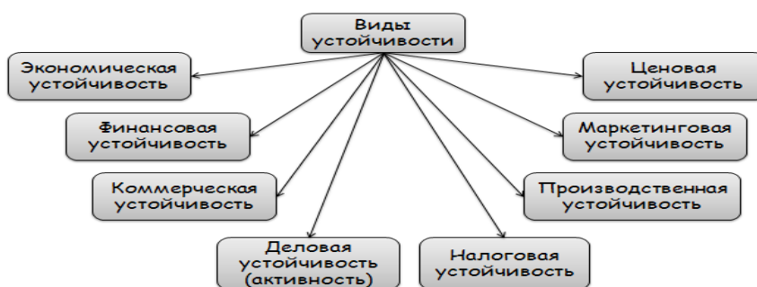
Рис. 4. Виды устойчивости

Как мы видим, на состояние устойчивости оказывают влияние факторы, которые по вектору воздействия подразделяются на внутренние и внешние. Все многообразие причин, которые в данной статье не представляется возможным в полной мере привести, обуславливают разные виды устойчивости, в которых доминируют те или иные факторы (рис. 4.).