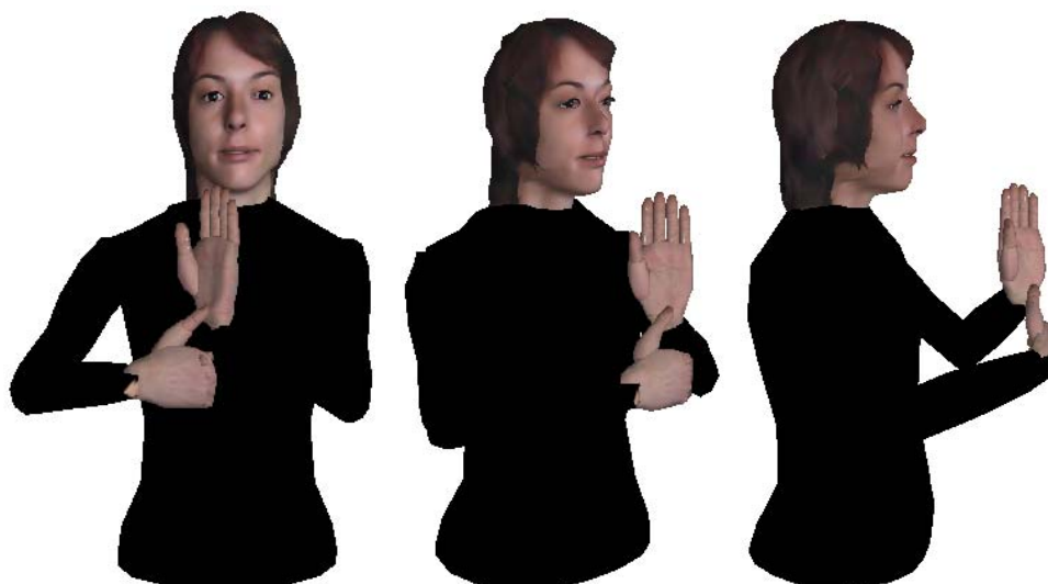
Рис. 3. Трехмерный жестовый аватар в различных проекциях

На вход системы подается произвольный грамматически корректный текст (на русском или чешском языке), который анализируется текстовым процессором, в нем выделяются предложения, слова (для аудиосинтеза речи и видеосинтеза артикуляции губ аватара) и буквы (для машинного синтеза дактильной речи [16]), которые автоматически преобразуются в символы жестовой нотации, на основе которой аватар воспроизводит мануальные жесты, декодируя символы нотации. Элементы жестовой речи в системе описываются при помощи системы записи жестов HamNoSys, отражающей основные дифференциальные признаки каждого жеста: форму кисти, ориентацию руки, место и характер движения. Виртуальная модель головы и верхней части туловища человека реализована на языке моделирования виртуальной реальности (Virtual Reality Modelling Language, VRML) и управляется программно средствами графической библиотеки OpenGL под управлением операционной системы семейства Microsoft Windows. Создан трехмерный жестовый аватар (signing avatar), который может иметь светлую либо черную одежду (в зависимости от предпочтений пользователя). Данный аватар, демонстрирующий финальную статью динамического жеста для числительного «16», показан в различных проекциях на рис. 3.