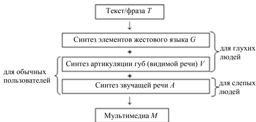
Рис. 1. Концептуальная модель универсального многомодального человеко-машинного интерфейса на основе синтеза аудиовизуальной речи и жестового языка

Такой пользовательский интерфейс вывода информации является универсальным, так как он предназначен для вывода входных текстовых данных посредством синтеза звучащей речи, артикуляции губ аватара и жестового языка как для обычных пользователей, так и для людей с ограниченными возможностями (глухих и незрячих людей).