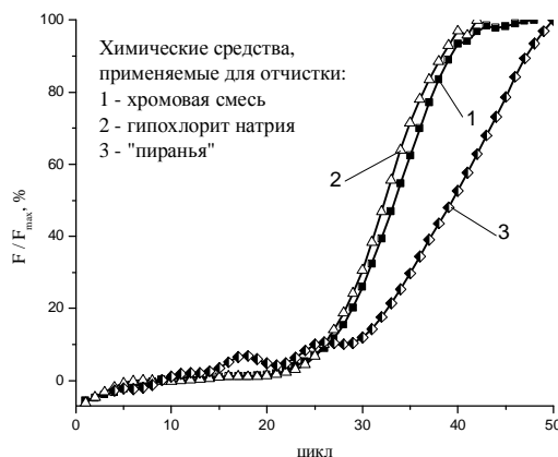
Рис. 2. Нормированные графики зависимости изменения флуоресценции во времени при проведении ПЦР в микрочипах, обработанных разными химическими растворами: 1 – хромовой смесью; 2 – раствором гипохлорита натрия; 3 – смесью концентрированной серной кислоты и перекиси водорода («пиранья»)

Стабильные и воспроизводимые результаты получены на микрочипе, обработанном хромовой смесью (рис. 2, зависимость 1). После 27-го цикла наблюдается изменение величины сигнала флуоресценции, что свидетельствует об увеличении количества анализируемых фрагментов ДНК.