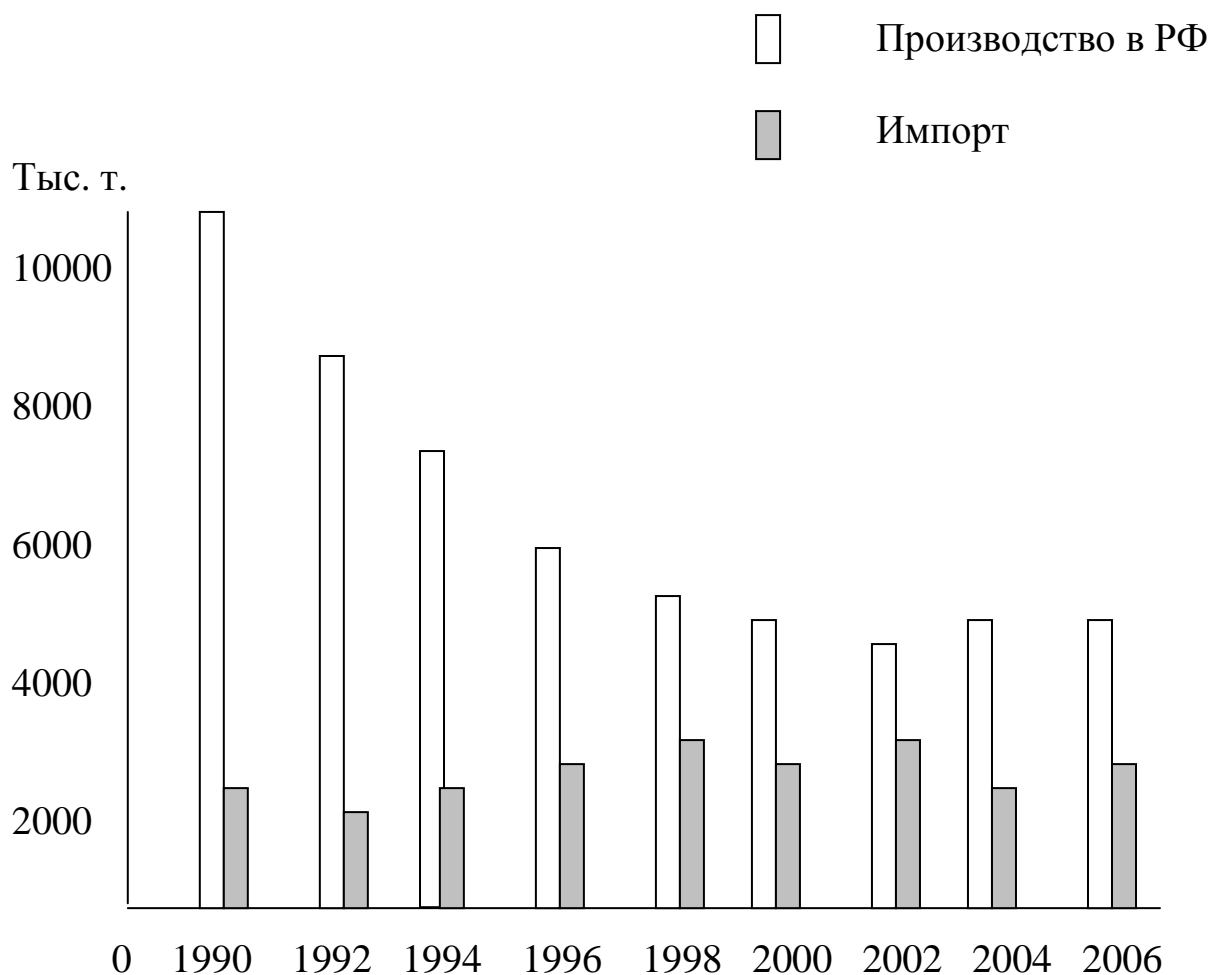
Рис. 2. Динамика производства и импорта мяса в Российской Федерации.