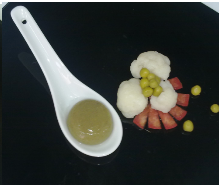
Рис. 2. Салат грибной