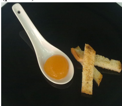
Рис. 1. Осенняя фантазия

В состав блюда № 1 входят: тыква, морковь и яблоки, а также несколько кусочков сладких сухариков для подачи (рис. 1). В состав блюда № 2 входят горошек зеленый консервированный, свежие шампиньоны, лук и бульон, для подачи используется цветная капуста, кусочек томата и горох (рис. 2). Блюдо № 3 состоит из таких ингредиентов: шампиньоны свежие, сливки 20%, фасоль, лук, бульон, подается с корочкой поджаренного хлеба и украшается петрушкой (рис. 3).