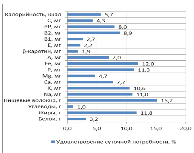
Рис. 6. Удовлетворения суточной потребности потребителя в питательных веществах за счет блюда №3, %

что данное блюдо можно считать диетическим.