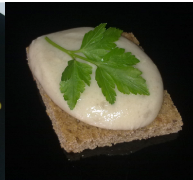
Рис. 3. Закуска особенная

На основе результатов экспериментальных исследований и общепринятых норм нами была разработана своя модифицированная система критериев органолептической оценки показателей полученных блюд [3] (табл. 1).