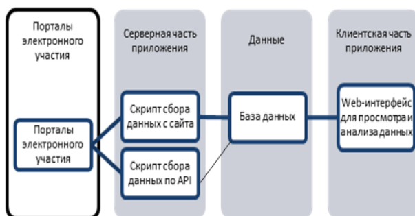
Рис. 1. Архитектура системы мониторинга порталов электронного участия

Сбор данных осуществлялся различными способами. Первый — это использование API (Application Programming Interface) для получения данных с сайтов, второй — синтаксический анализ (парсинг) исходного кода страниц сайта (рис.1).