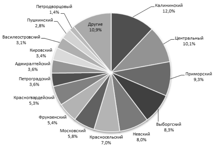
Рис. 3. Распределение запросов по районам города на платформе «Наш Петербург», 2015 г.

Однако стоит отметить, что период максимальной (пиковой) активности горожан на порталах существенно отличался: пик по числу заявлений на «Красивом Петербурге» пришелся на март 2015 г., а на «Нашем